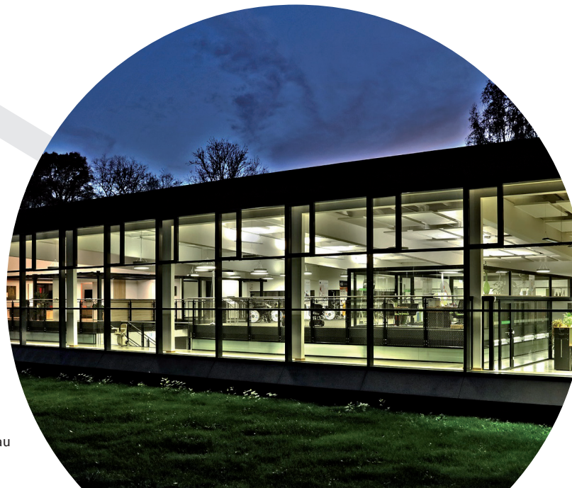
Westfälische Hochschule Zwickau

Entwicklung und Automatisierung von Energiesystemen zur Kopplung der Sektoren Wärme, Strom und Mobilität unter Berücksichtigung regenerativer Energiequellen