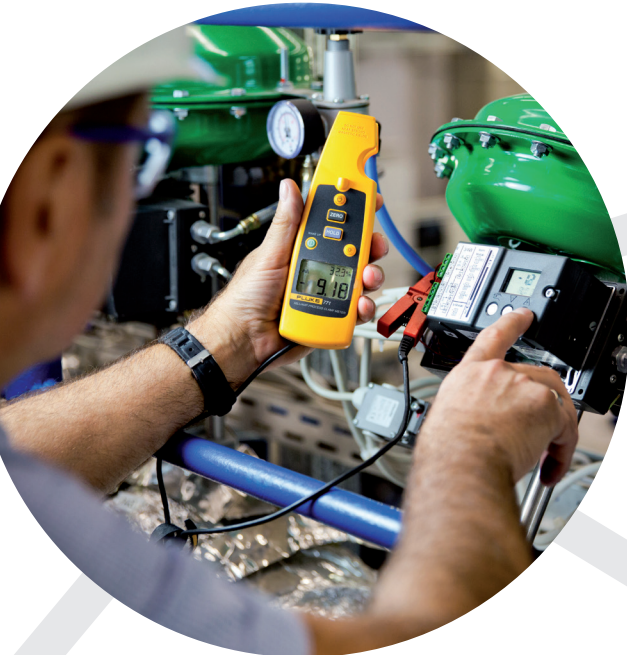
Hochschule Zittau/Görlitz, IPM

Das Co-Creation Lab Versorgungsinfrastruktur hält fachspezifisches Know-how sowie eine Vielzahl an virtuellen und realen Testumgebungen für Sie bereit. Analysieren, simulieren und optimieren Sie Ihre Anwendungsfälle im Herzen Europas am Standort Zittau: am neuen Experimentier- und Weiterbildungsleitstand. Profitieren Sie von unserem erweiterten Netzwerk inklusive der Hochschulen für angewandte Wissenschaften Zittau/Görlitz, Leipzig, Mittweida, Zwickau und Dresden sowie vieler Praxispartner.